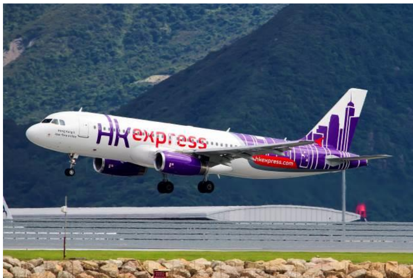
上图：香港快运航空以“点心”为主题命名 5 架航机，其中“虾饺”和“烧卖”已于近期推出。

机票预订可透过香港快运航空网页 www.hkexpress.com 或致电客户服务热线：4000 122 388。了解更多信息，可登入香港快运航空新浪微博专页 www.weibo.com/hkexpress 、关注香港快运航空微信公众账号以及 Instagram 账号 @HK_Express。