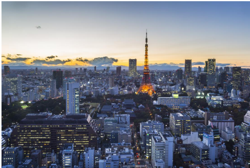
上图：连同于 12 月 8 日即将开办的东京-成田航线，香港快运航空将提供一日三班往返香港及东京的航班。